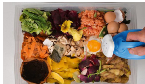
Illustration : compostage