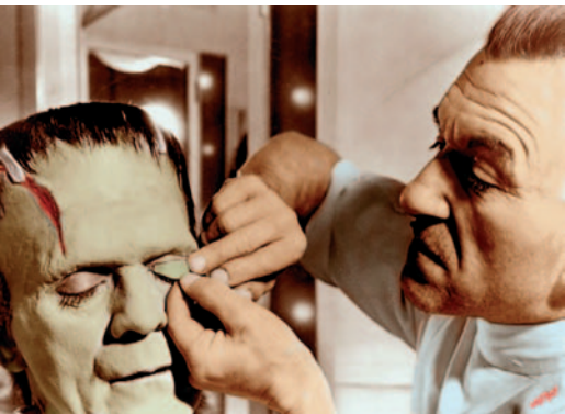
Le maquilleur Jack Pierce et Boris Karloff (La créature).